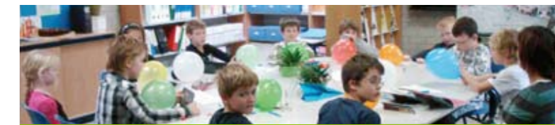
Groep 5/6 op "de Noord" tijdens de inleiding van de filosofieles. Op ballonnen schreven de kinderen waaraan ze een hekel hadden

Onder de titel "Wie mag het zeggen" willen wij in de volgende Erasmusbulletins steeds een leerling aan het woord laten. Het kan in deze stukjes over van alles gaan, maar met name natuurlijk over onderwerpen die betrekking hebben op de Erasmusklass.