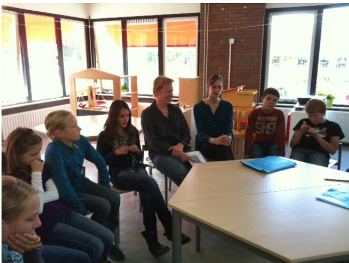
De kinderen van 7/8 tijdens de filosofieles van de Erasmusuniversiteit