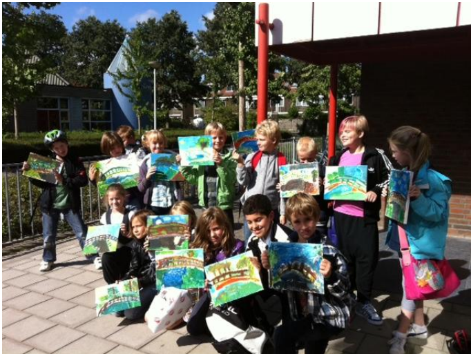
De kinderen van 5/6 met hun werkje over impressionisme

We hebben erg leuke onderwerpen gehad, zoals: regels, dierenproeven, mens vergelijken met dieren en een les over allemaal filosofen. We hebben ook erg leuke opdrachten moeten doen, we moesten bijvoorbeeld discussiëren over deze stelling: stamt de mens af van de dier? Dan kreeg je in groepjes van 3, een WAAR of een NIET WAAR, en daar moest je dan argumenten voor bedenken waarom het wel of niet zo zou zijn. Daarna moest je met een groepje discussiëren dat de andere stelling had. Dat vonden we allemaal erg leuk. Ook kregen we in groepjes van 2 allemaal kaartjes. Daar stond iets op, zoals: het water van de zee is koud. Dan moest je dat kaartje neerleggen bij: ZEKER, NIET ZEKER of TWIJFEL. Ook dat was leuk. We moesten ook een keer een foto van ons huisdieren meenemen, we gingen toen vertellen over ons huisdier. En we gingen het toen over proefdieren hebben, en waarom die nodig zijn. We vinden het allemaal erg jammer dat die lessen afgelopen zijn.