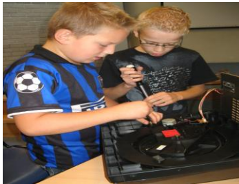
Groep 5/6 vergelijkt oude